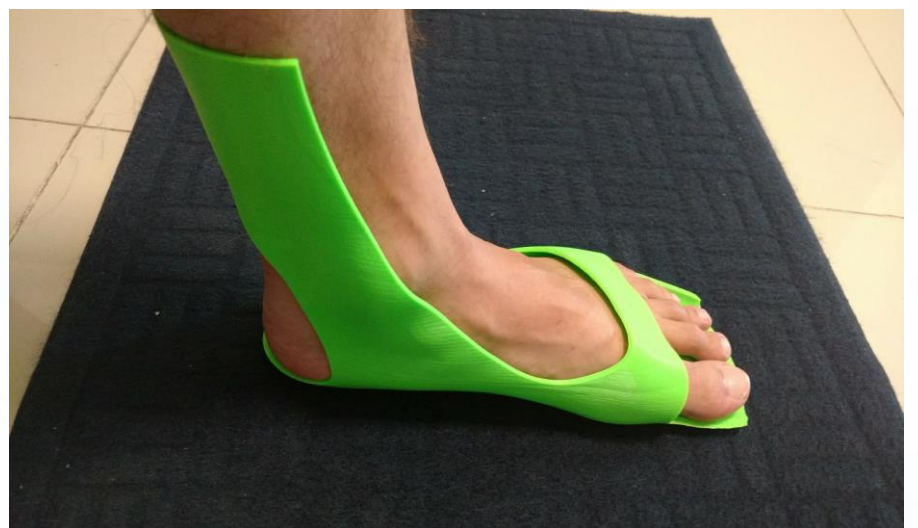
Figura 2. Órtesis impresa en 3D

De esta manera garantizamos una férula u órtesis personalizada y propia para cada paciente, lo que conlleva a una mejor y pronta recuperación de la lesión para el paciente.