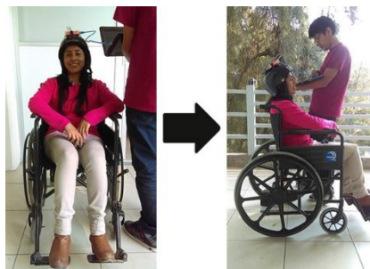
Fig. 4. Sistema adaptado a la silla de ruedas