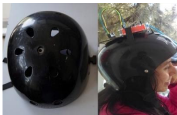
Fig. 1. Sistema de control

Se presenta el diseño, desarrollo y funcionamiento de un sistema de control mediante una máquina de estados capaz de manipular una silla de ruedas. El sistema se ha caracterizado para que un paciente con cuadriplejía controle los desplazamientos de la silla de ruedas, con los movimientos de su cabeza.