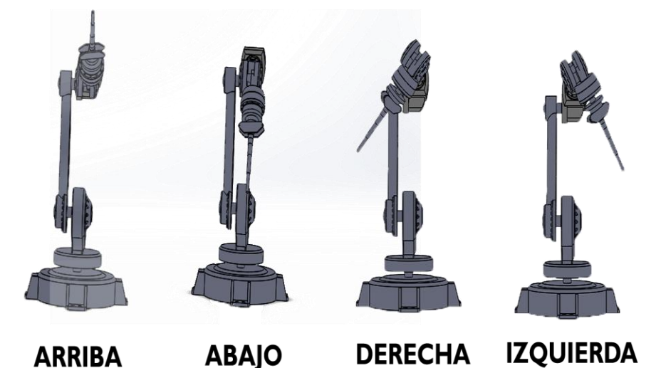
Fig. 4. Movimiento del brazo