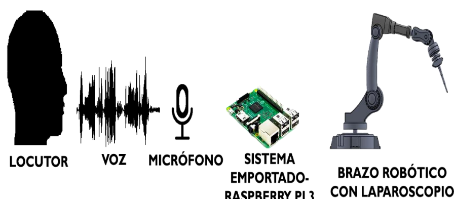
Fig. 1. Funcionamiento del sistema de control por voz y brazo laparoscopio.