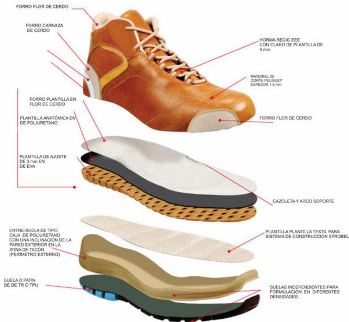
Figura 4. Elementos del Calzado para persona con diabetes

Las especificaciones descritas para el calzado permiten de cierta forma disminuir los riesgos en los pies a los que se somete una persona diabética con el uso del calzado habitual como lo son: Fricción con el calzado en zonas acras o salientes de los huesos de los pies. Zonas de hiperqueratosis o callosidades en la planta de los pies o dorso de los ortijos (dedos). Zonas de hiperpresión plantar o dorsal. Ulceras por contacto y fricción. Isquemia o contacto excesivo con el