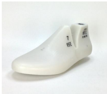
Figura 3. Horma de calzado para caballero con diabetes

A partir de las dimensiones de la horma se planteó el desarrollo de un calzado para diabéticos. Adicionalmente para el diseño del calzado se identificaron los puntos de la propuesta de norma de calzado para diabéticos considerando los puntos críticos en el calce de acuerdo a las dimensiones, en la figura 4 se muestra el calzado desarrollado con todos sus elementos. Con base en la información reportada y los requerimientos se desarrolló el diseño de la suela.