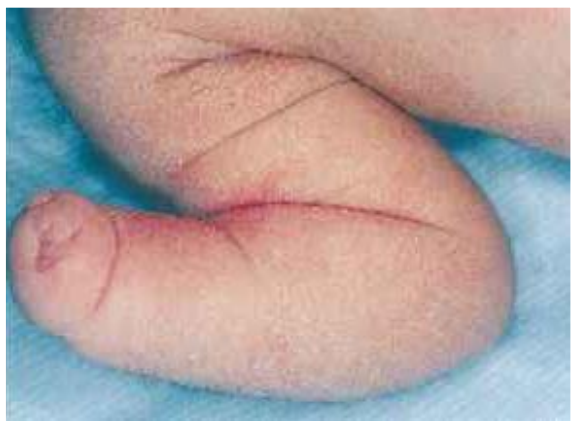
Fig. 2 Alteración Congénita de Formación Zonal

Ausencia de dedos y metacarpianos del eje central de la mano, estando presentes el radio y el cúbito.