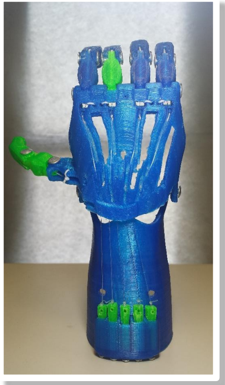
Fig. 4 Prótesis Mecánicas elaboradas en el HU

Los primeros prototipos de prótesis diseñados para pacientes exclusivamente con falta de falanges y una articulación de muñeca funcional, ya están siendo utilizados de manera correcta. Personal en el área de rehabilitación del Hospital Universitario, busca nuevos pacientes diariamente para ser parte del programa y con ello apoyar a más personas con estas características. Fig.4