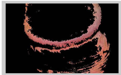
Figura 2. Filtro con distancia