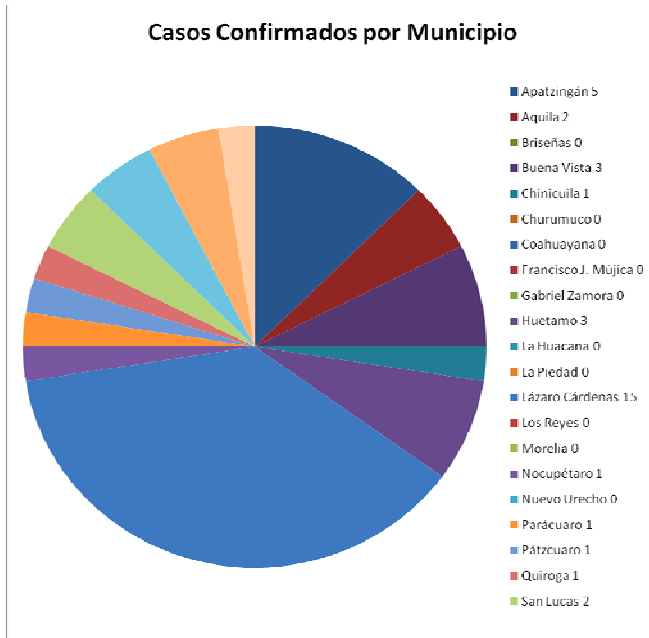
Figura 3. Esquema de Casos Confirmados por Municipio