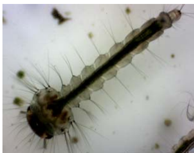
(Larva de mosquito Aedes aegypti )

La enfermedad está condicionada en buena medida a la distribución del Aedes aegypti , que se reproduce en las viviendas de prácticamente todas las zonas urbanas del área de riesgo en México.