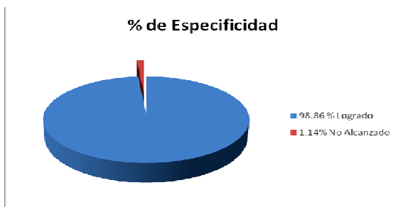
Figura 19. Esquema Porcentual de Especificidad de las Pruebas Rápidas Human Hexagon