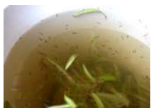
(Criadero de mosquitos)

En estas áreas, las condiciones para la proliferación del vector se presentan en una sociedad donde prevalecen la falta de conciencia, conocimiento y actitud de las familias en el control y eliminación de criaderos, así como la carencia de prácticas de autoprotección, como el uso de mosquiteros en puertas y ventanas o el uso de insecticidas domésticos, además de la dificultad para que los programas locales de control implementen de forma oportuna, secuencial, sincronizada y con cobertura completa, las acciones anti-vectoriales, incluyendo la integración y participación de la comunidad.